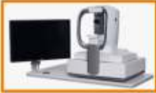
OCT - આંખનું CT - Scan

અત્યાધુનિક લેસરથી આંખનાં લેન્સનું મેઝરમેન્ટ