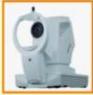
IOL Master 700

Eye Checkup (૧૮ વર્ષથી ઉપરના માટે) અને મોતિયા બિંદુ તથા લેસિક સર્જરીની પ્રાથમિક તપાસ પર