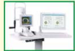
VERION ઇમેજ ગાઇડેડ કેટેરેક્ટ સર્જરી

Offer Valid till 31st August - રજીસ્ટ્રેશન કરાવવું જરૂરી (વહેલો તે પહેલોના ધોરણે)