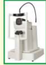
Anterior - આંખનું લેઝર સ્કેનર

Experience અને Latest Technology નો સમાવેશ