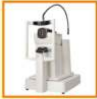
Pentacam HR & Corvis ST

આર્ટીફિશીયલ ઇંટીલીજન્સાયુક્ત CT - Scan - કોર્નિયા સ્ટ્રેટિથ એનાલીસીસથી Pre Lasik પરિક્ષણ