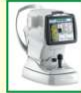
Specular Microscope કોર્નિયાનું આંતરિક સુક્ષ્મ પરિક્ષણ