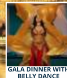
GALA DINNER WITH BELLY DANCE