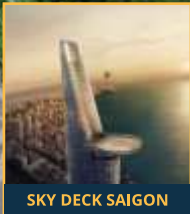
SKY DECK SAIGON