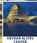
HEYDAR ALIYEV CENTER