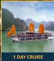
1 DAY CRUISE