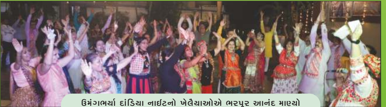
ઉમંગભર્યા દાંડિયા નાઈટનો ખેલૈયાઓએ ભરપૂર આનંદ માણ્યો