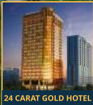
24 CARAT GOLD HOTEL