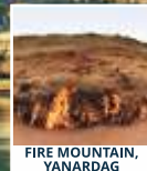
FIRE MOUNTAIN, YANARDAG